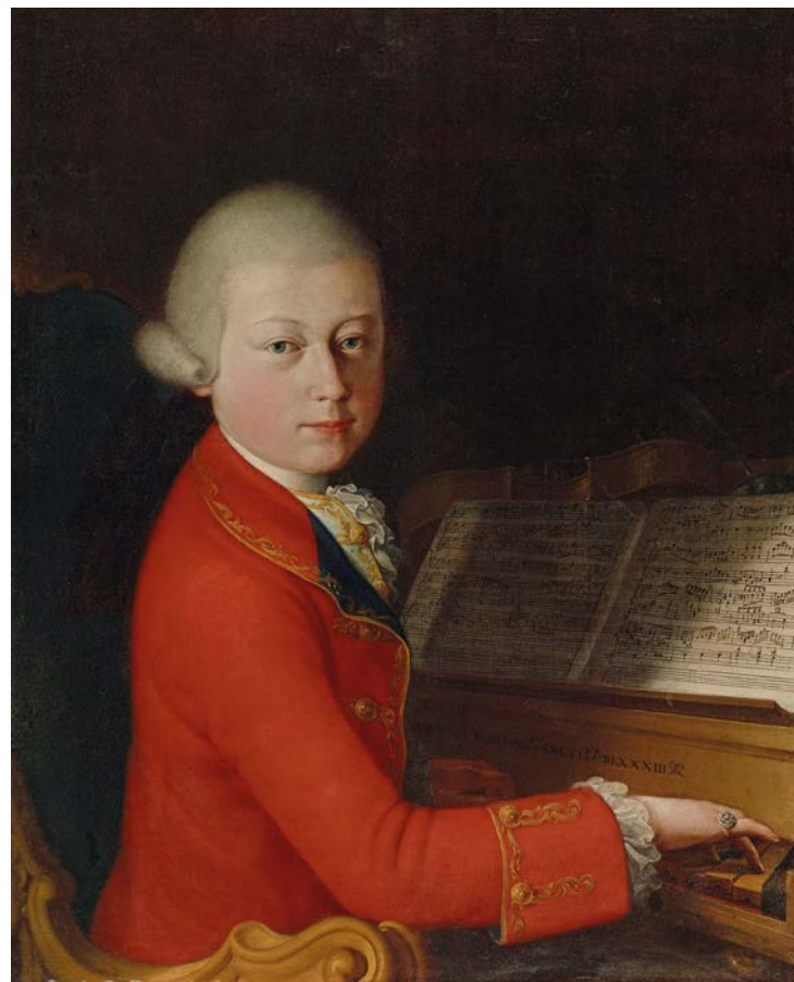
Giambettino Cignaroli, Wolfgang Amadeus Mozart , ca. 1770.

Da questa sospensione metafisica emerge l'esuberanza incontenibile di un Mozart sedicenne che nel Divertimento K 136 mette il suo genio a disposizione della convivialità aristocratica; eppure, già in queste pagine giovanili, Mozart trasfigura l'intrattenimento in una lezione di equilibrio e trasparenza. La scrittura per archi ha la chiarezza della conversazione intelligente: temi brevi, linee luminose, dialoghi continui fra le parti. Nulla è ridondante, nulla eccede. Dietro la grazia spontanea dell'Allegro, dietro l'eleganza cantabile dell'Andante e l'energia scintillante del Presto finale, si avverte già la naturalezza di un pensiero musicale che sembra miracolosamente nascere compiuto. La stessa civiltà del suono attraversa la "Piccola musica notturna", emblema dell'immaginario mozartiano, in cui convivono chiarezza formale e sottile teatralità, spirito danzante e precisione architettonica. Materiali apparentemente semplici,