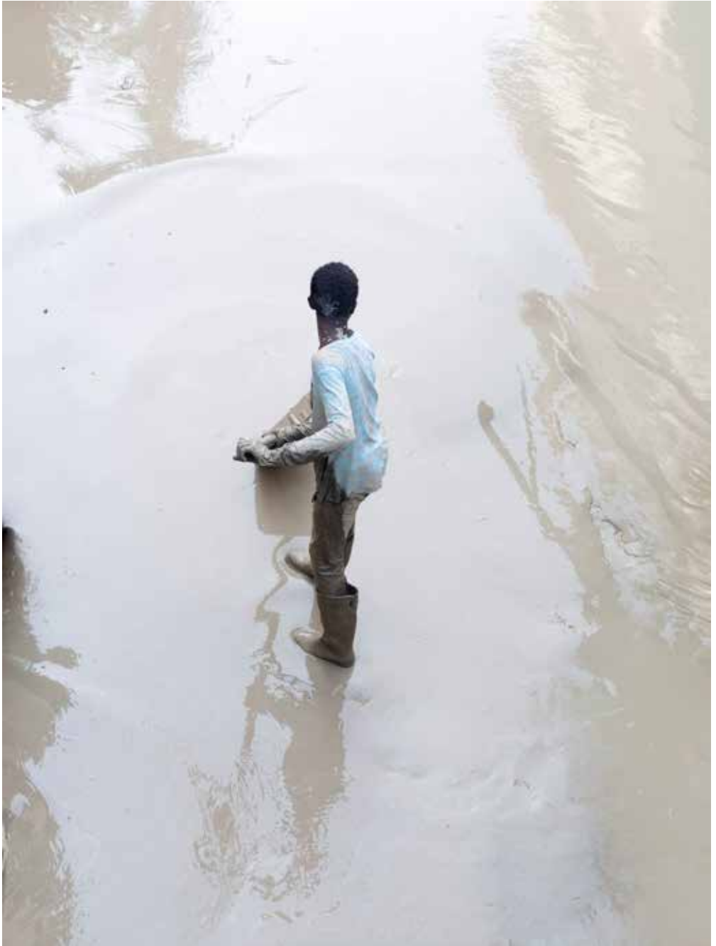
Angeli del fango , Forlì, 2023