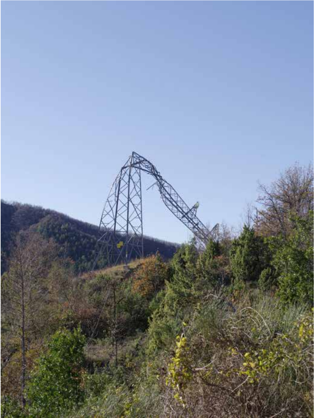
Romagna sfigurata , Porcentico, Predappio (FC), 2024