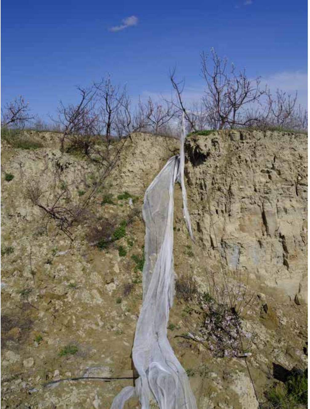
Romagna sfigurata , Comune di Brisighella (RA), 2024