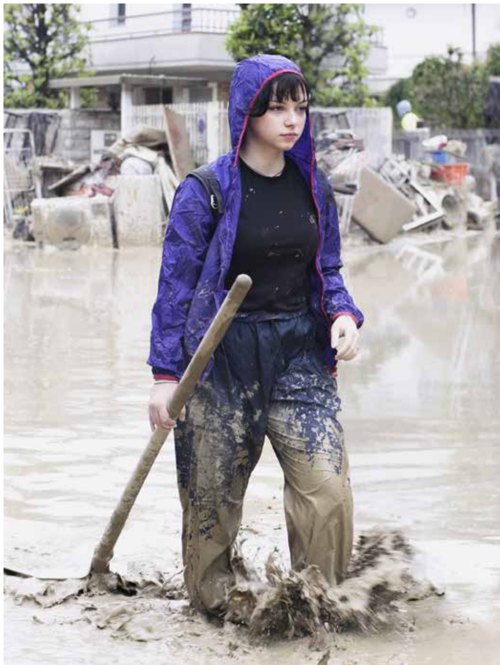
Angeli del fango, Forlì, 2023