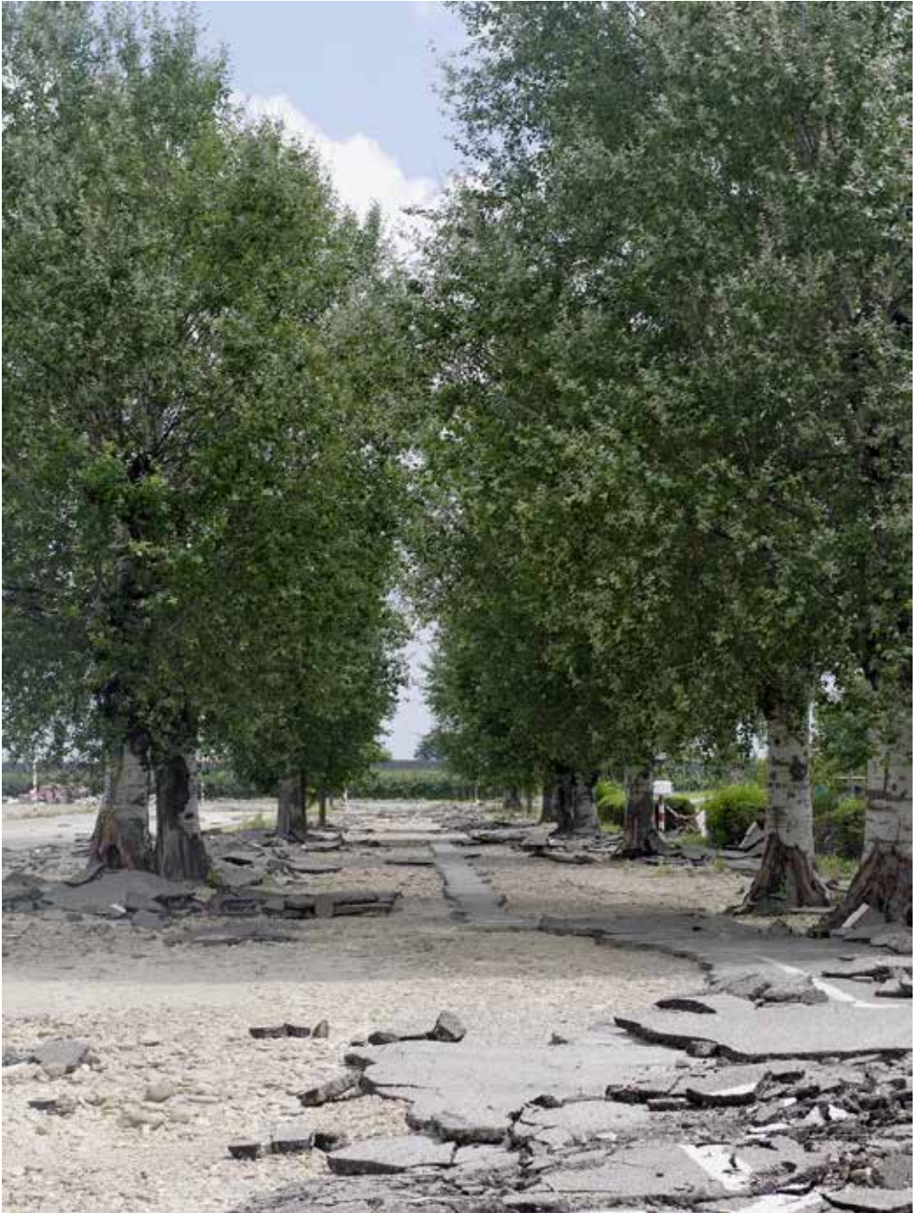
Discoteca le Cupole, Castel Bolognese (RA), 2023