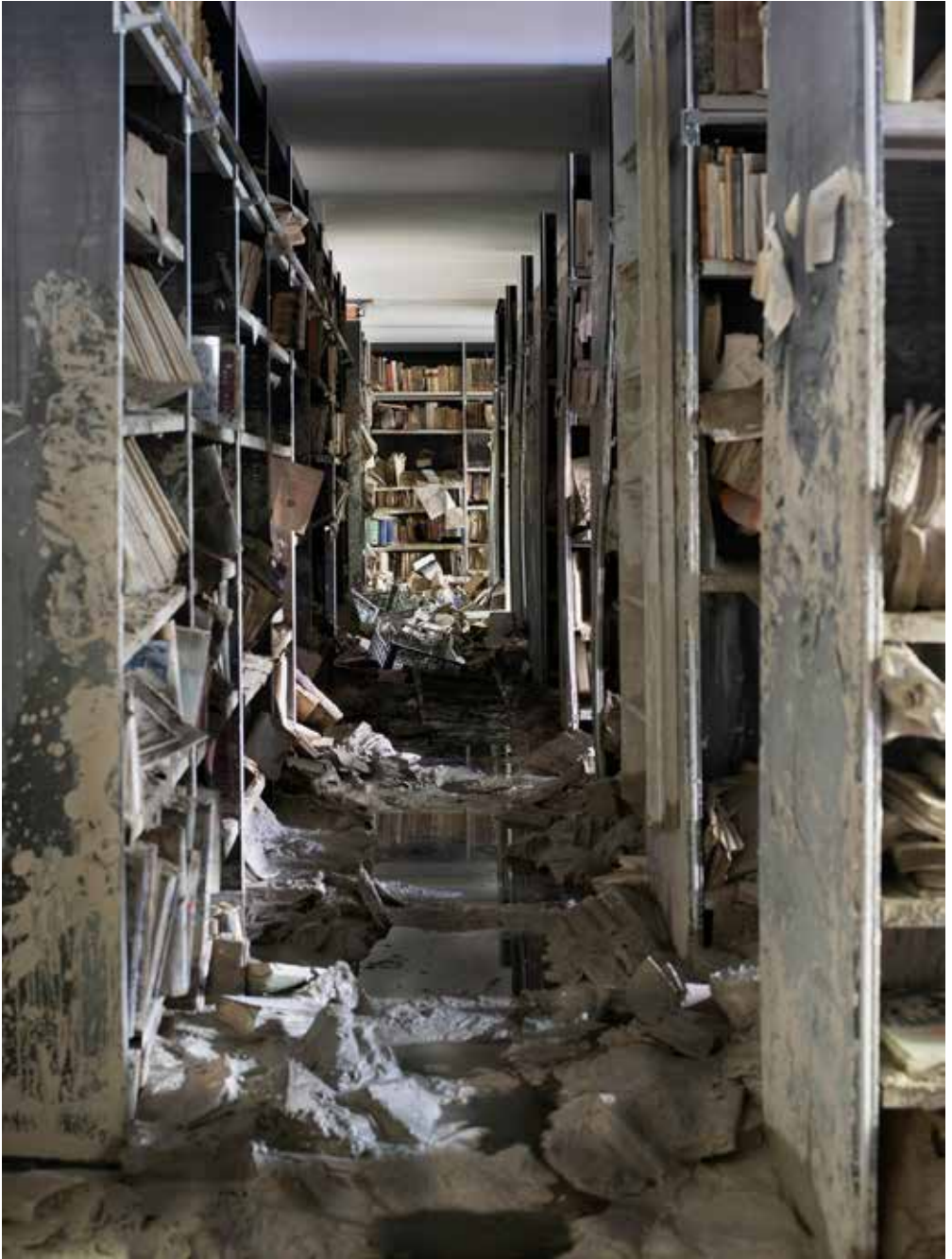
Sommersi salvati , Biblioteca del Seminario Vescovile, Forlì, 2023