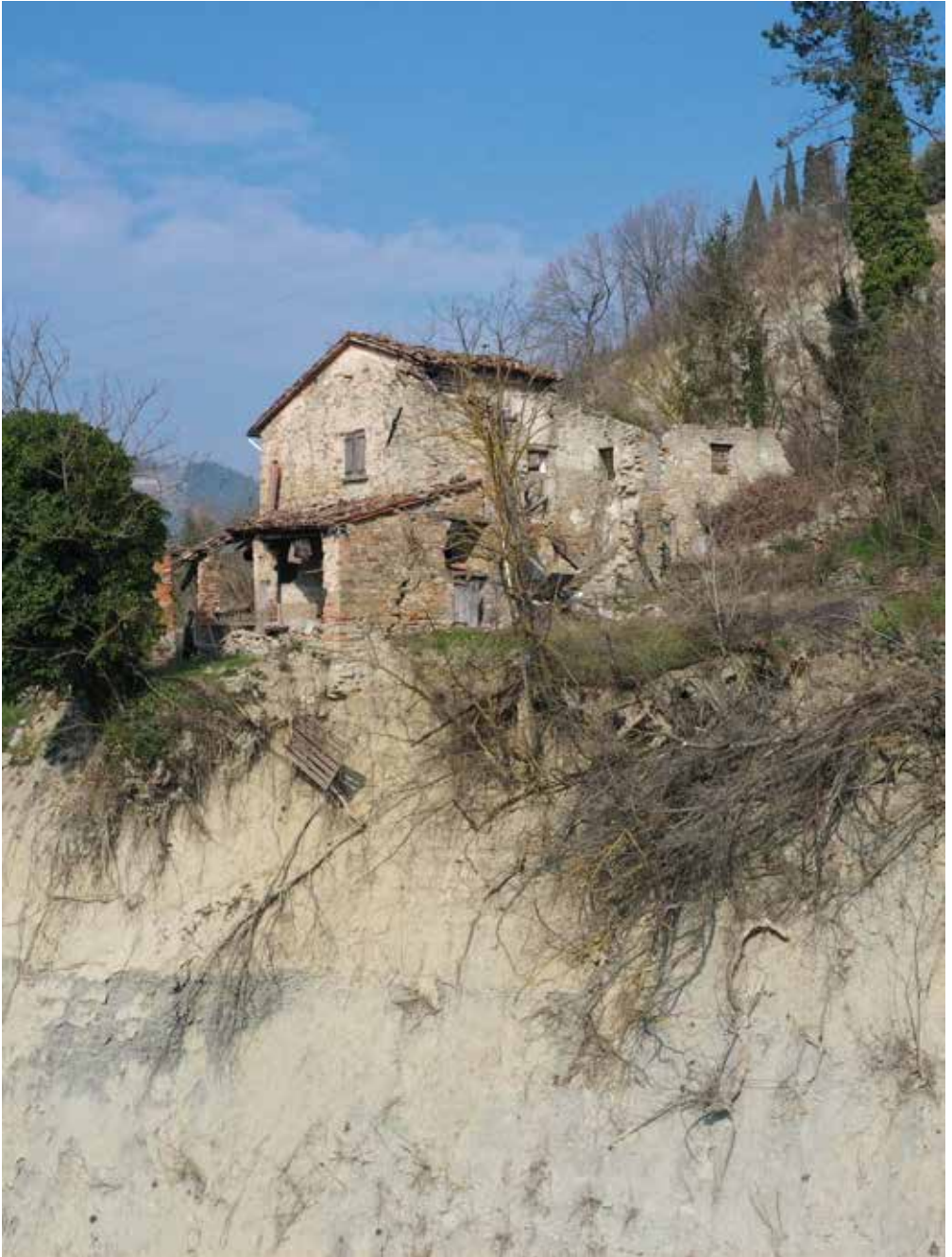
Romagna sfigurata , Modigliana (FC), 2024