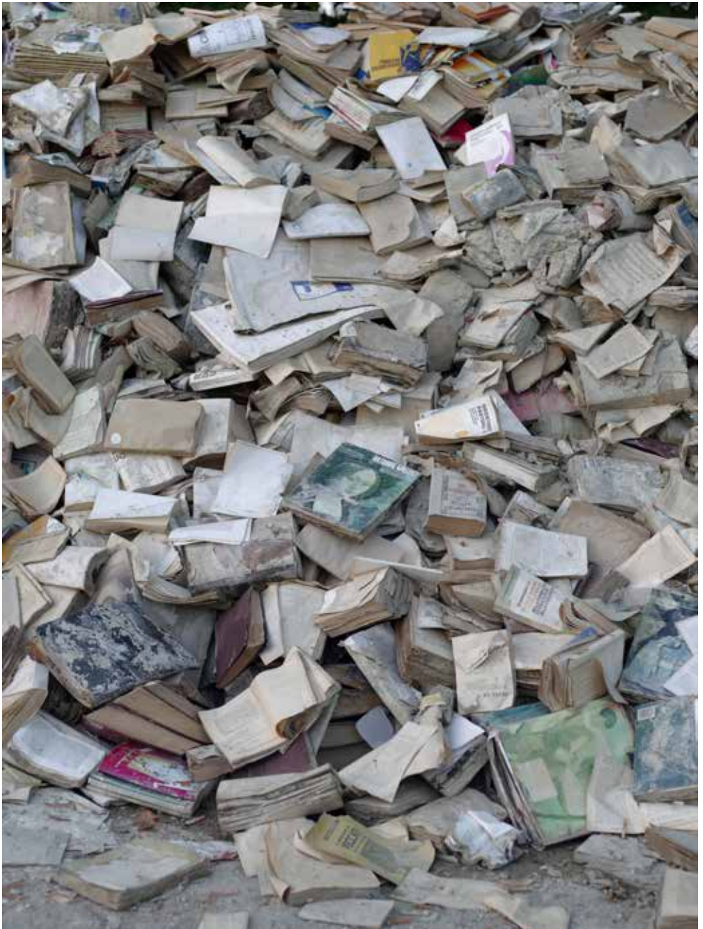
Sommersi salvati , Biblioteca del Seminario Vescovile, Forlì, 2023