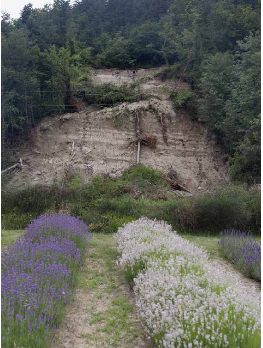
Romagna sfigurata , Casola Valsenio (RA), 2024