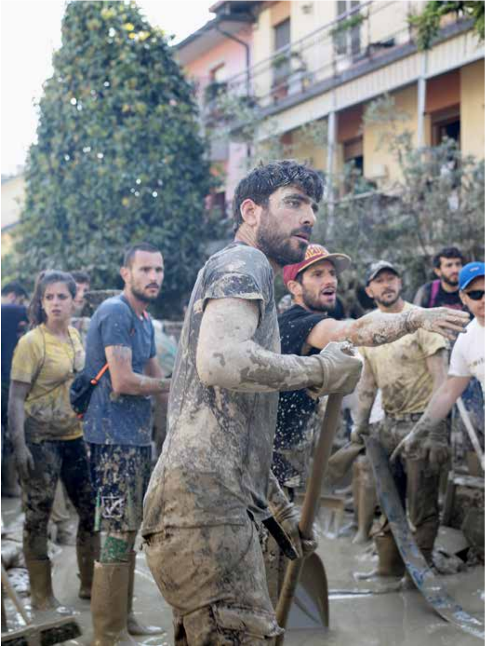
Angeli del fango, Forlì, 2023