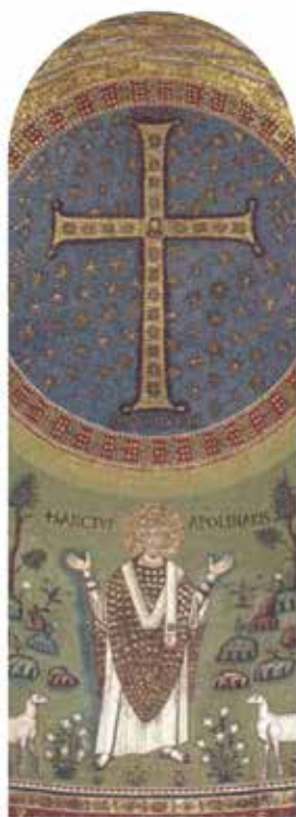
BASILICA DI SANT'APOLLINARE IN CLASSE