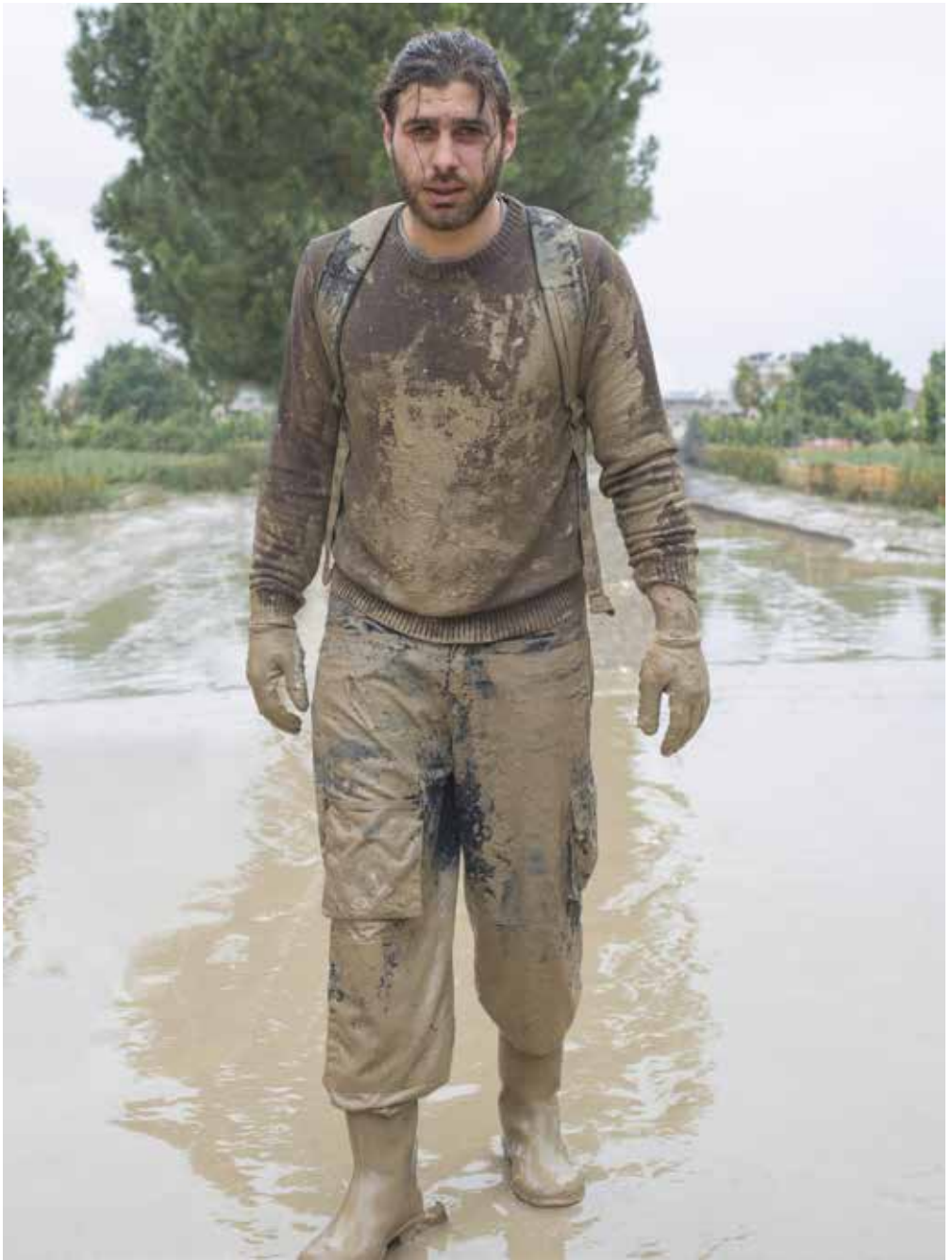
Angeli del fango, Forlì, 2023