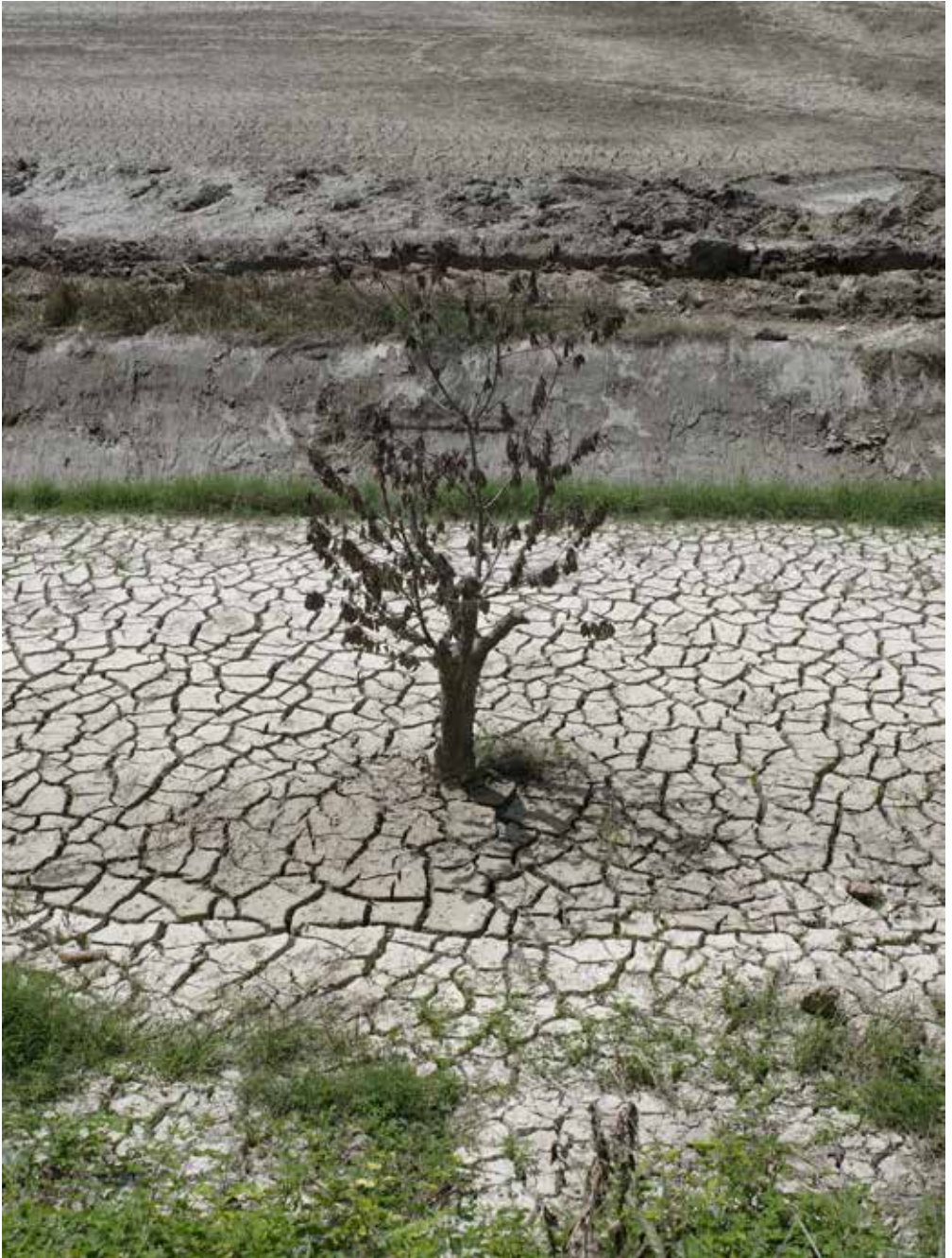
Nei pressi del fiume Ronco, Forlì, 2023