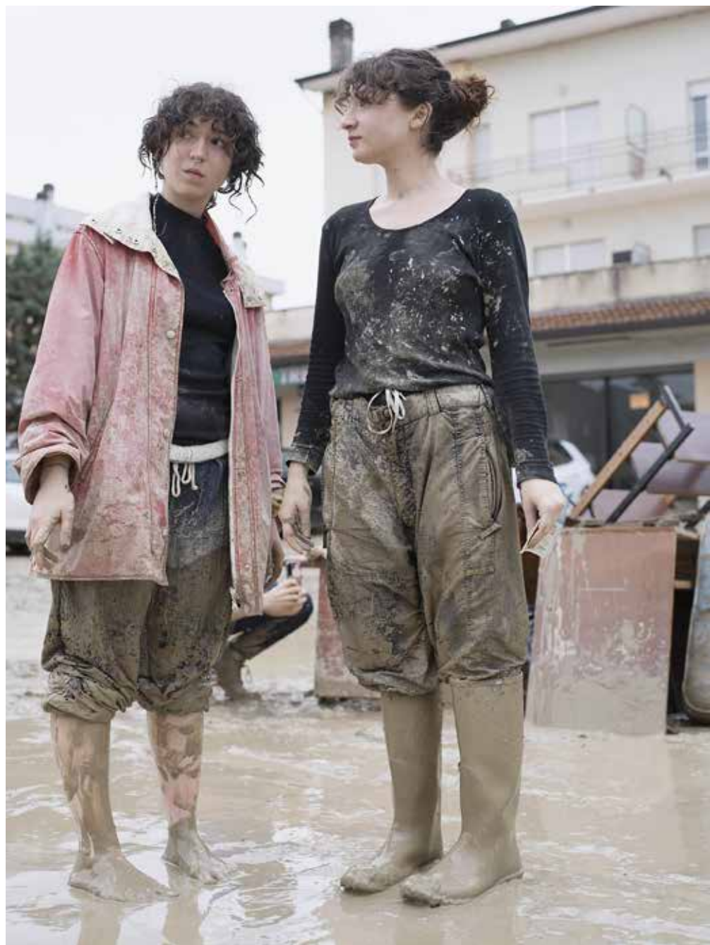
Angeli del fango , Forlì, 2023