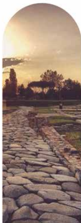
ANTICO PORTO DI CLASSE