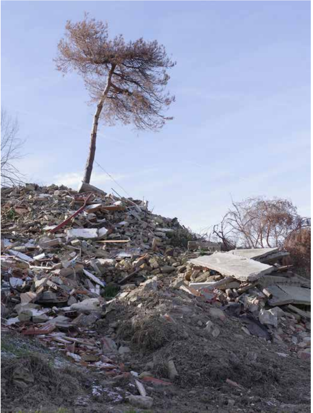
Romagna sfigurata , Casola Valsenio (RA), 2024