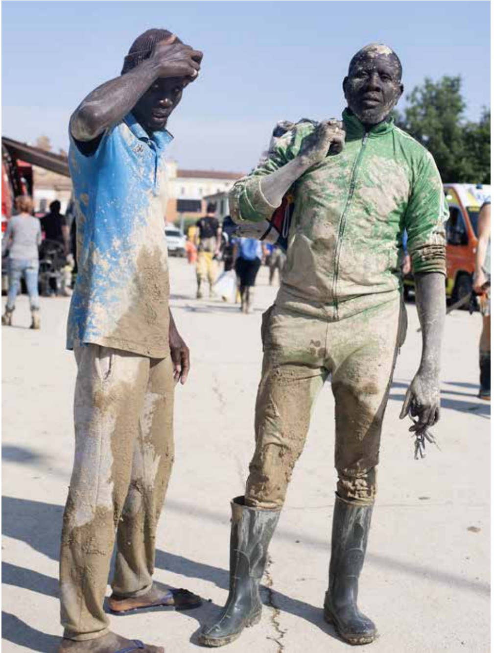
Angeli del fango, Forlì, 2023