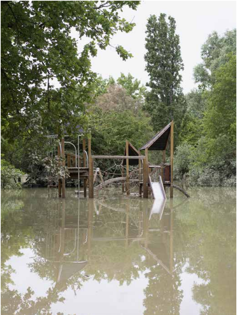
Parco urbano, Forlì, 2023