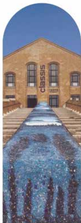
MUSEO CLASSIS RAVENNA