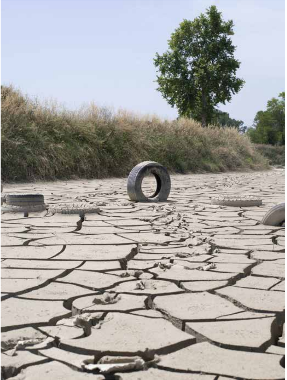
Pista moto Galliano park, Forlì, 2023