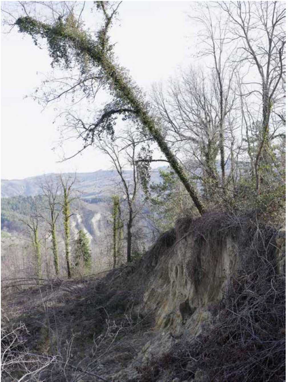
Romagna sfigurata , Comune di Civitella (FC), 2024