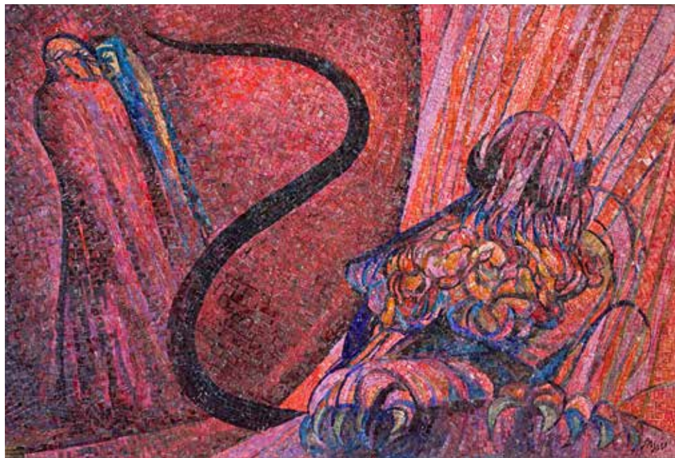
Lucifero , mosaico di Giuseppe Salietti, 2014, dalla tempera e pastello su carta di Aligi Sassu (Ravenna, Museo Tamo).

musica di Mariacostanza D'Agostino, Gabriel De Pace, Damiano Ferretti