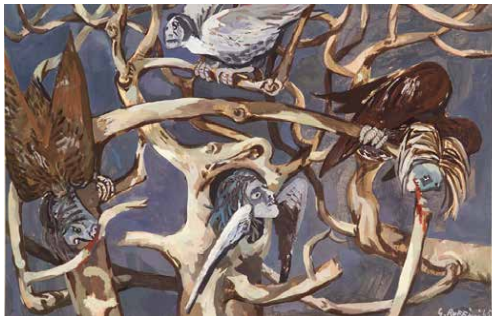
Giulio Ruffini, Le Arpie , tempera su carta fissata su masonite, 1965.

è strutturato in Cornici, in cui una voce recitante dialoga, all'inizio, con echi del Canto I dell' Inferno dantesco, e Quadri, in cui la parola vive solo nel canto. Procede per apparizioni, a suggerire un viaggio personale con lo sguardo rivolto al nostro presente.