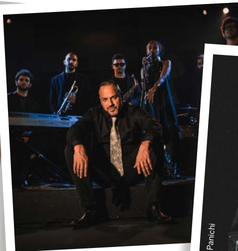
Murubutu & Moon Jazz Band